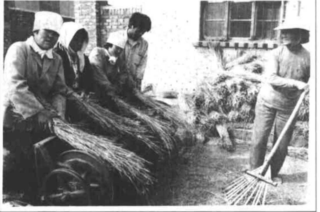
河口区积极营造“以库定稻”的农业生产模式。几年来，先后投资2500万元修建水库50余座，总蓄水量达2000万立方米，并在此基础上开发稻田2万亩。今年全区水稻普遍长势良好，平均亩产可达500公斤。

东营区辛店镇东南角有个不足400口人的小村叫景屋。 近几年来，村党支部加强了与附近油田单位的共建工作，油地互相支援，互相帮助，结下了深厚的友谊，也解决了村里的许多难题。油田总机械厂有二千多亩稻田在景屋的地面上，每逢灌水时，村里就先浇油田的地，后浇本村的地。每逢插秧、放水、收获等季节，村里都派上五六个人，由村里出工钱，看护油田的庄稼和水果。而油田单位对景屋的支援更大。几年来，每逢清淤、搞水利建设，都是油田单位无偿地出机械。这个村离干线公路1.5公里，每逢雨天，道路泥泞难行。今年5月，油田总机械厂出动推土机、挖掘机等大型机械，帮助这个村修起了路基，使这个村铺上了硬化路面。7月份，村里打算修一个占地40亩的水库，总机械厂又出动机械帮助推土15万方。村里计划把旱田改成水田，因水源不足，有人提议用附近电厂排出的废水，村里对水取样化验，认为可用，便向附近的胜利发电厂求援。胜利发电厂经研究后答应了村里的要求，并安排基建科帮助搞管道施工。在电厂的帮助下，这个村投资11万元，修了50米长的引水管道，利用了电厂的废水，使这个村东南部的800亩地全浇上了水。为配合油田水泥厂的建设，这个村办起了土方队、装卸队、建安工程处三个企业，突破了村村办企业零的记录。去年这个村的人均收入只有1000元，今年预计可达到2600元。 （任星光 沈航）